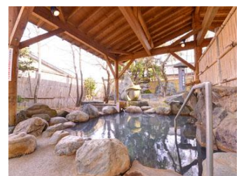
肌・身体にやさしく、温泉からあがっても冷めにくい「あったまりの湯」

当館は、客室十八室と小さな旅館ですが、小さい旅館だからこそのおもてなしを一杯できればと思っています。