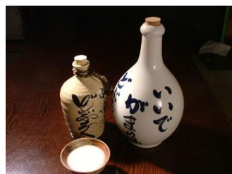
過去に全国どぶろく大会で最優秀賞を受賞したこともあるどぶろくです。