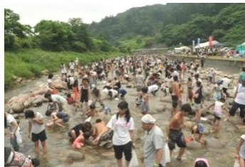
前回の「朝日川溪流祭り」

大江のうまいもの市」が開催されます。大江町のいいもの・うまいものを販売することに加え、毎回楽しい企画が盛りだくさんです。今回は、前日の19日と当日の20日の二日間JR左沢駅にSL(本物!)がやってきます。また、ミニSLが駅前広場を走ります(20日のみ)。その他、お楽しみ抽選会、各種プレゼント、ミニライブ等、お子様からおじいちゃんおばあちゃんまで、どなたからも楽しんでいただける楽しいイベントです。ぜひ足を運んでみてください。(次回3回目は9月7日です)