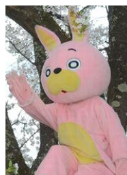
朝日町の非公式キャラクター「桃色ウサビ」 朝日が育んだ圧倒的無個性。