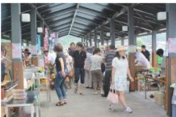
前回の「大江のうまいもの市」の様子 大江のうまいもの、いいものが勢ぞろい

会」が開かれ、その様子が6月26日のツイッターのデイリーランキングで1位になりました。(2位 集团的自衛権、4位 サッカーワールドカップ)「きれいな空気は町の誇り。議会から全国に発信したい」とのコメントがありました。また朝日町の4大祭りの1つ「朝日川溪流祭り」が8月3日開催されます。岩魚、ヤマメ、ニジマスなどのつかみ取りで大自然とおもいっきりたのしんでみませんか。