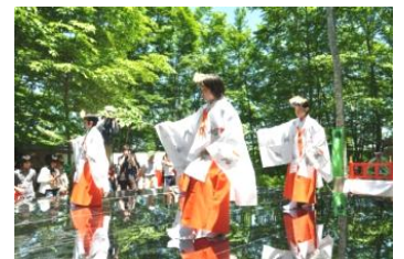
空気まつり名物の「巫女の舞」

さる6月5、7、8日 朝日自然観にて空気祭りがおこなわれました。世界環境デーの5日「空気に感謝する議