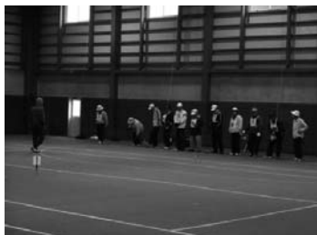
小国支店長杯ゲートボール大会