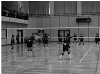
山形中央信用組合理事長杯争奪 西置賜地区中学校 バレーボール強化大会