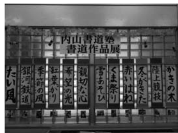
本店営業部 内山書道塾作品展