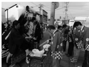
長井黒獅子まつり