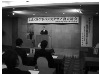
本店営業部 アドバンスクラブ設立総会