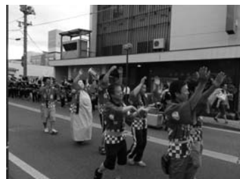
長井踊り大パレード