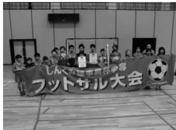
「しんくみ理事長杯」争奪 フットサル大会