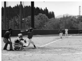
信組杯争奪社会人野球大会